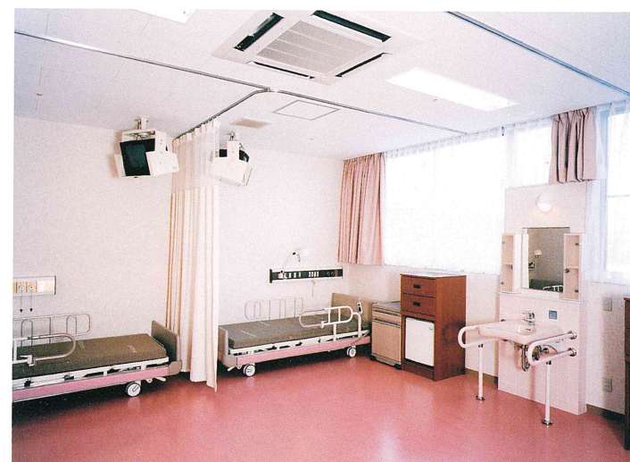
療養室(4人室×1、酸素・バキューム完備)