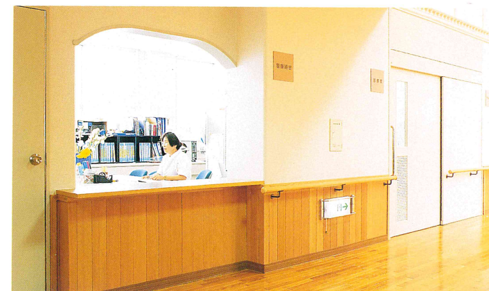
ナースステーション

この安らぎは、 私たちの真心です。 明るく開放感のある療養室は、 安らぎとくつろぎの空間です。 冷暖房完備、各室トイレ・洗面 所など、お年寄りが安心して使 えるよう設計されており、スタッ フとの連絡態勢も万全です。お 年寄りがゆつりと、無理のない療 養生活を送っていただけます。