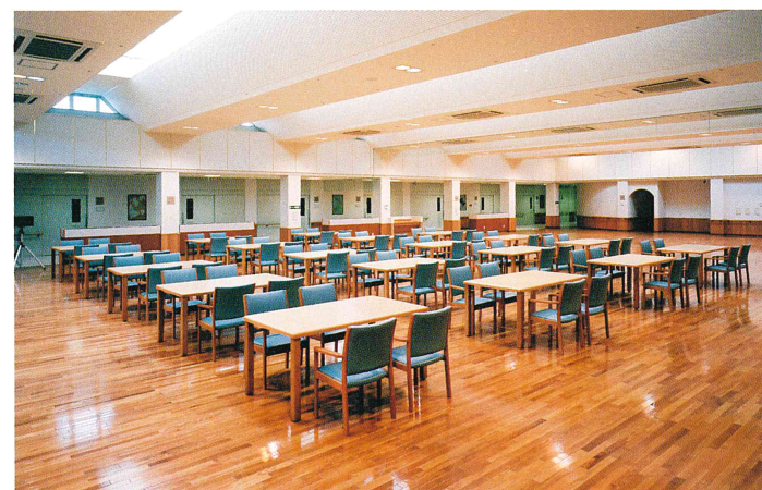
食堂兼レクリエーションルーム