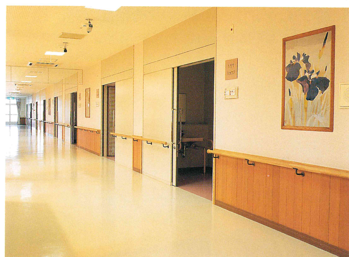
一般入居者棟通路