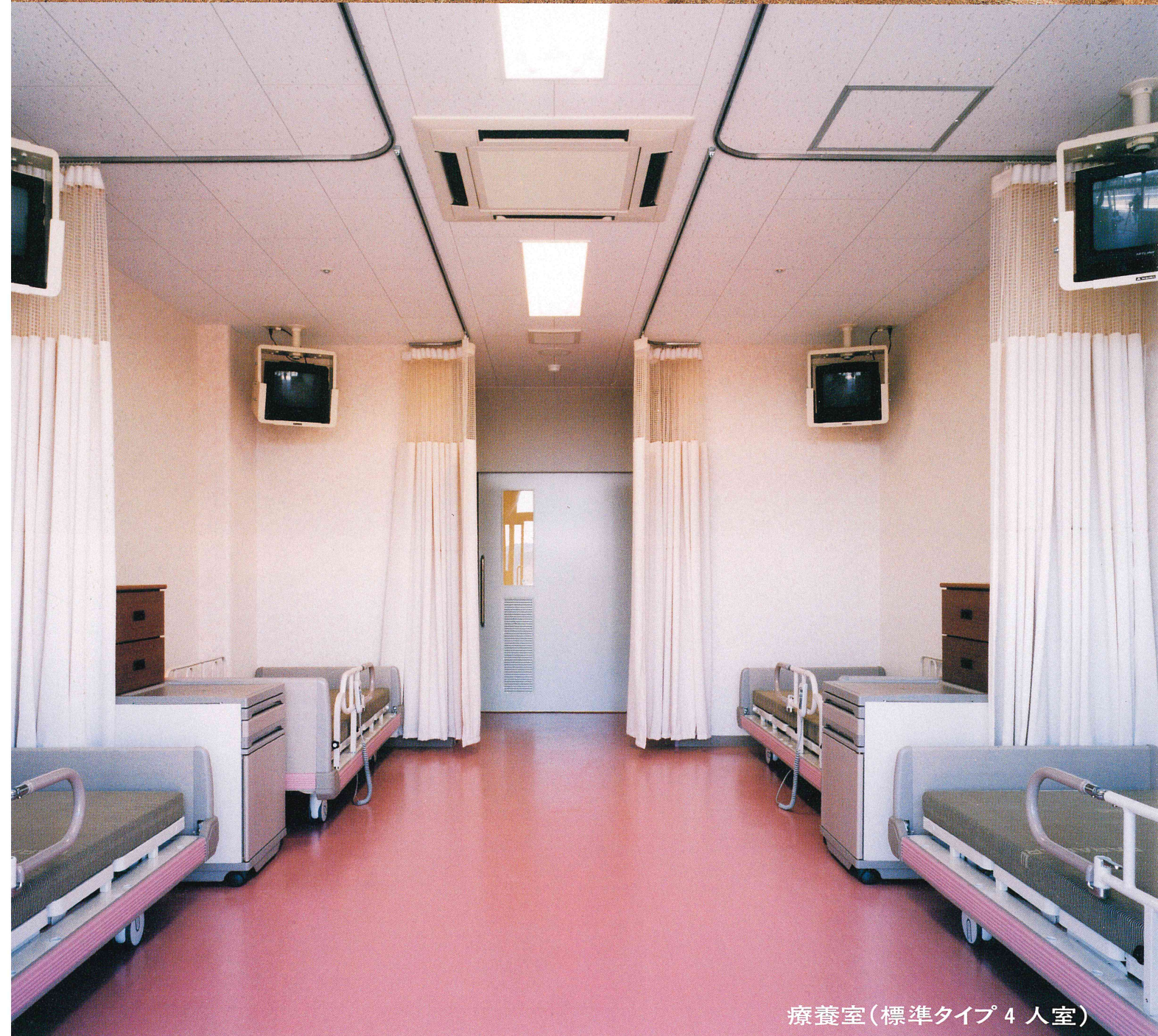
療養室(標準タイプ4人室)