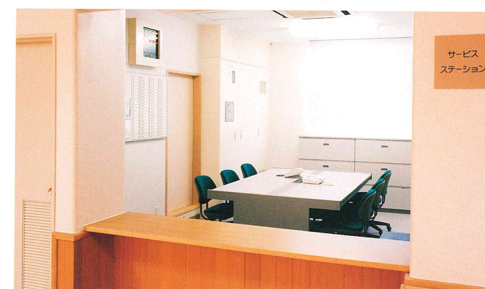
サービスステーション