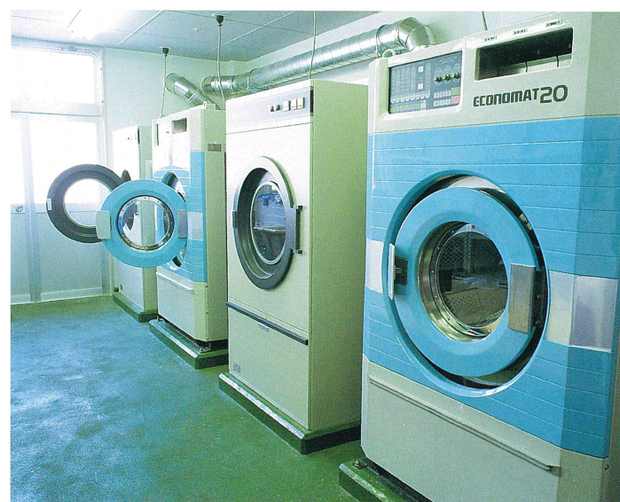
洗濯室(洗濯機×2、乾燥機×2)